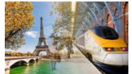
Seo pictiúr den Eurostar. Tá an Túr Eiffel sa phictiúr seo freisin!

Is traein é an Eurostar a théann ó Londain go Páras. Ní thógann an turas seo ach 2 uair go leith. Tá an traein seo an-tapa. Téann sé ar luas 300 ciliméadar san uair!