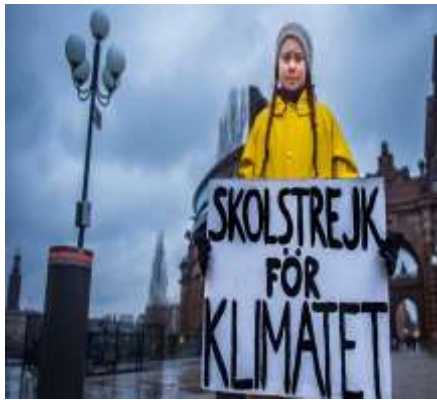
Seo í Greta!