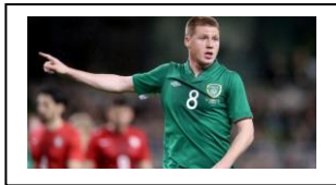
James McCarthy ag imirt le foireann na hÉireann.